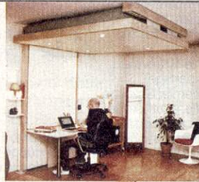
Le lit qui se range au plafond, la solution idéale quand on a peu de place.

Deux solutions s'offrent à vous: la mezzanine fixe, qui libère de la surface au sol mais dont les pieds et l'échelle (ou l'escalier) pour accéder au couchage restent encore un peu encombrants; ou, très à la mode (mais plus cher!), le plateau mobile qui, la journée, se range au plafond et, le soir, redescend pour vous offrir un lit confortable (www.decadrages.com).